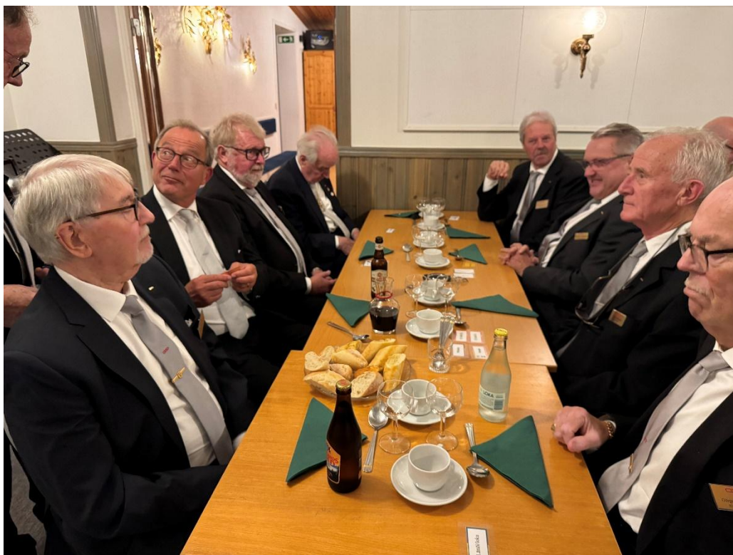
Bröderna väntar tålmodigt på att få förse sig av den matiga gulaschsoppan

Apollosalen anträdde därefter för intag av dagens måltid, som bestod av Gulaschsoppa med Smetana.