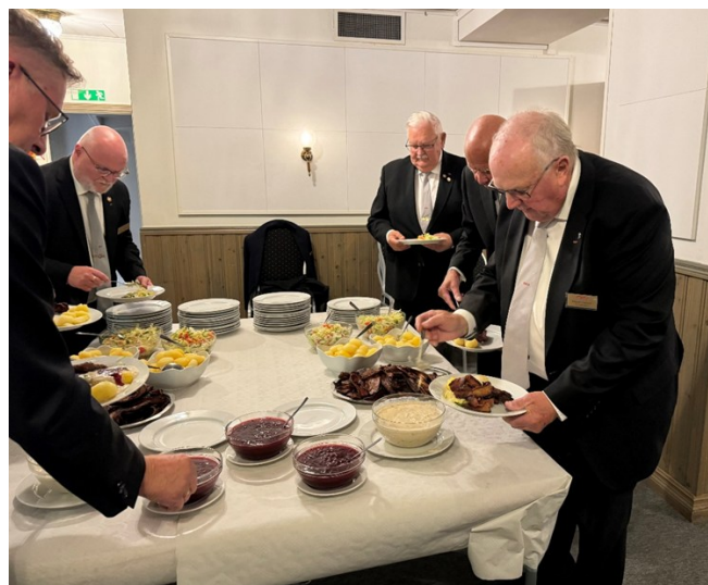
Menyn föll bröderna på läppen.