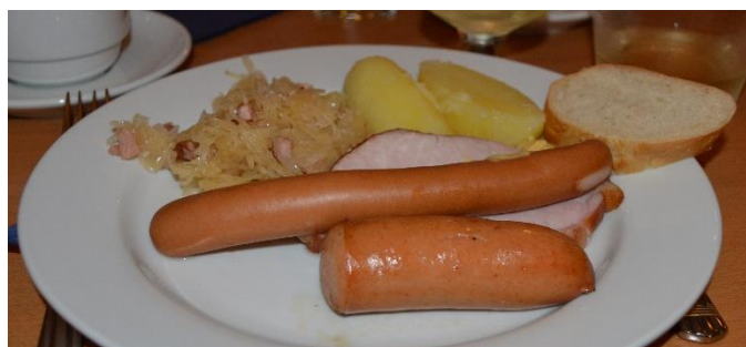
Menyn på tallriken

På menyn stod choucroute med tillbehör såsom olika korvar, kassler och potatis. Choucroute betyder sauerkraut fast på franska. Det är en rätt från Elsass.