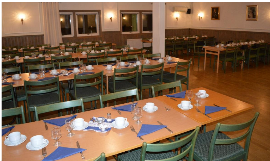
Apollosalen är redo för brödramåltiden

Efter arbetets avslutande samlades bröderna i Apollosalen.