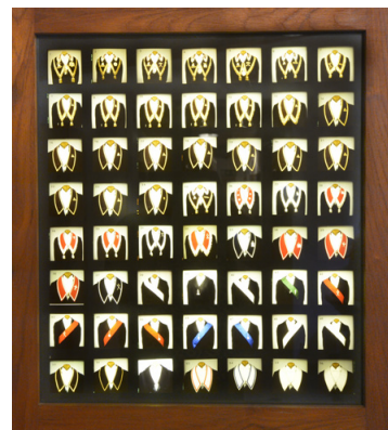
SYMBOLVÄRDE. Varje regalie symboliserar medlemmarnas ställning i Logen.

– Nej det är hemligt, det har jag inte ens berättat för min fru. Hon brukade säga till barnen när de frågade vad pappa gjorde på kväl-