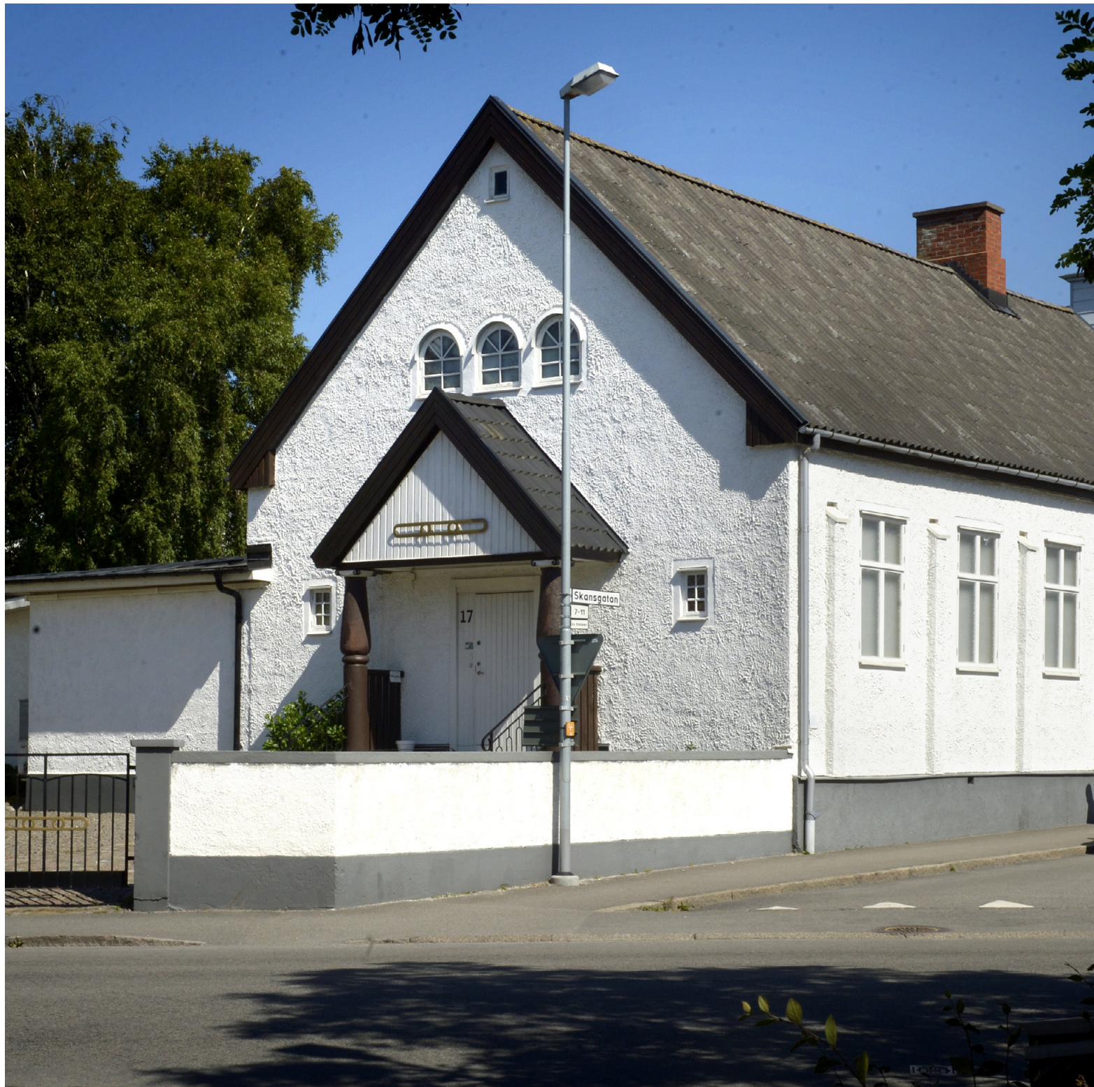
JUBILEUM. Tabernaklet fyller 100 i år, Odd Fellows samlingsssal

TVÅÅKER: Någon gång under tisdagskvällen vandaliserades delar av utemiljön på Bogårdsskolan i Tvååker. En eller flera personer har varit på platsen och dragit upp ett antal nyplanterade buskar vid entrén. Samma sak hände för drygt två veckor sedan. I polisanmälan konstateras även att någon valt och eldat på utemöbler, tagit sönder ett solskydd och förstört solceller på taket till idrottshallen. Enligt anmälan har grannar gjort vissa iakttagelser under kvällen den 17 juli men i nuläget finns ingen misstänkt.