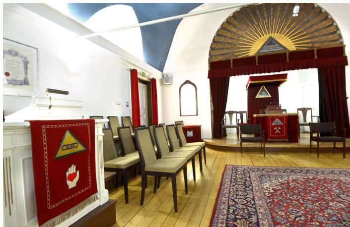
SALEN. Här har Odd Fellows bland annat sina graderingar av medlemmarna.