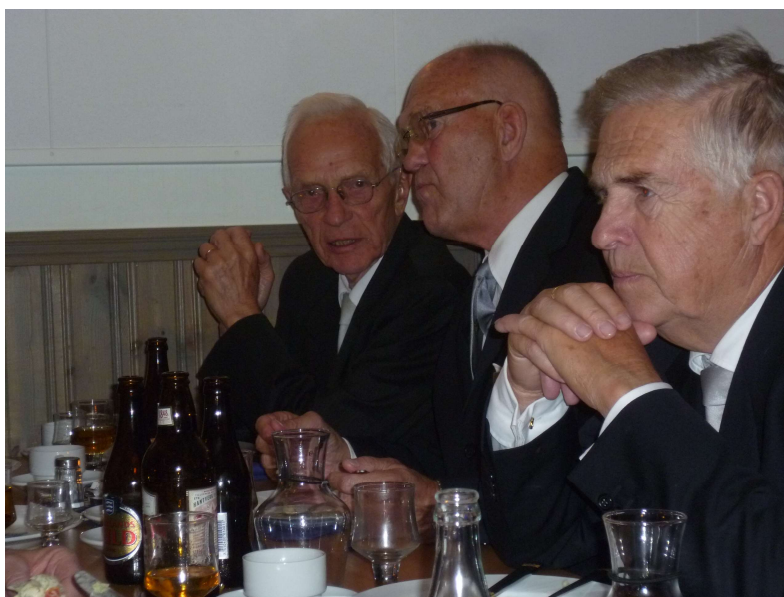
Nöjda lyssnade bröder