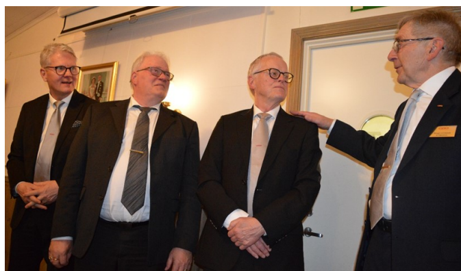
De nya bröderna hälsas välkomna

I Apollosalen undfägnades hungriga (?) bröder med fläskfilé, potatisgratäng och picklade legymer (dock utan lingon till ÖM)! Ett stort tack till köket.