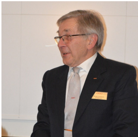
ÖM hälsar bröderna välkomna i den nya graden.