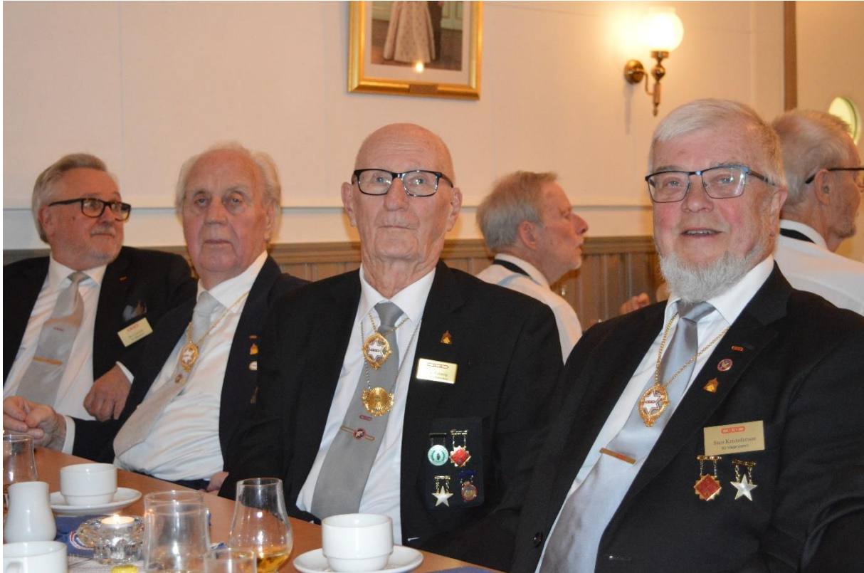
Kaffet kom och avnjöts med mazarin och eget valt tillbehör.