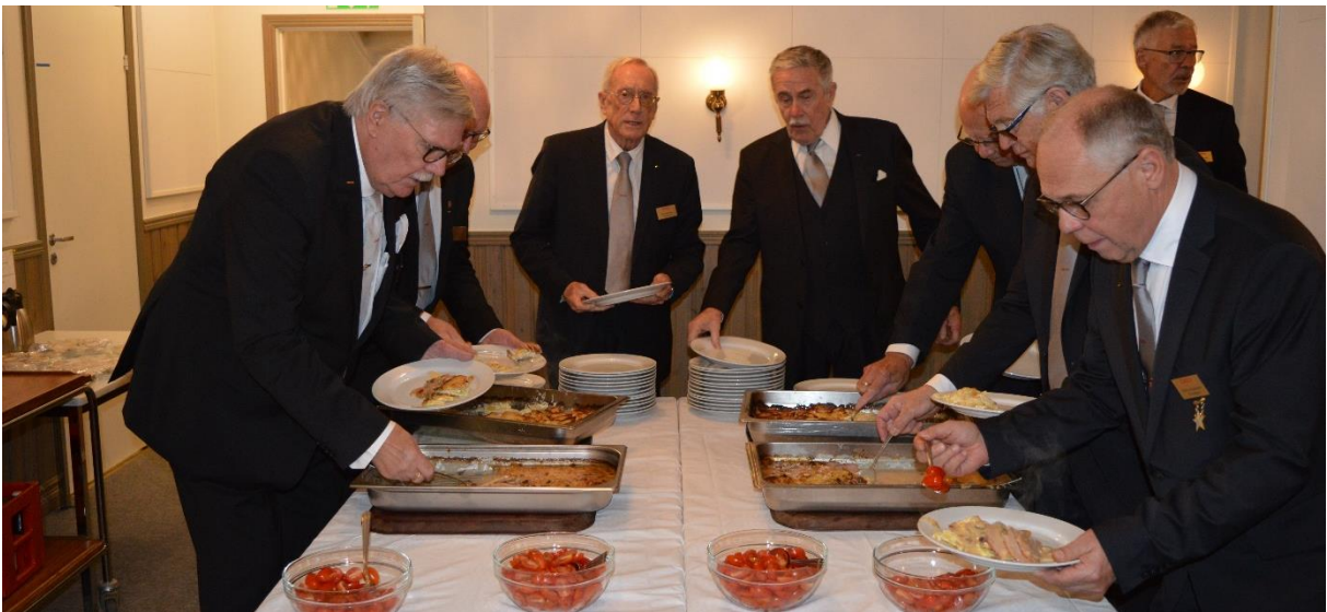
Det var strykande åtgång.

På menyn stod kasslergratäng med potatisgratäng.