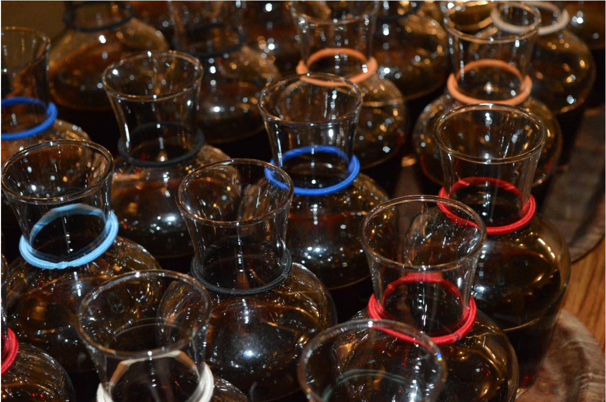
Karafferna är förberedda.

På menyn stod kasslergratäng med potatisgratäng.