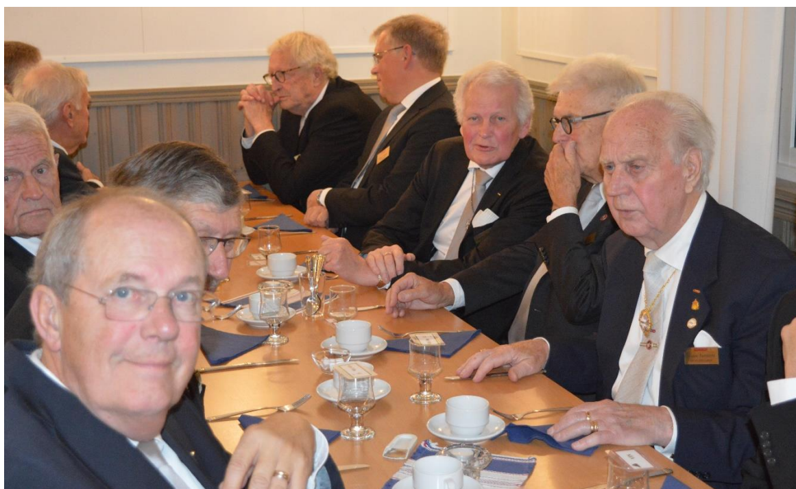
Konversationen är livlig vid bordet