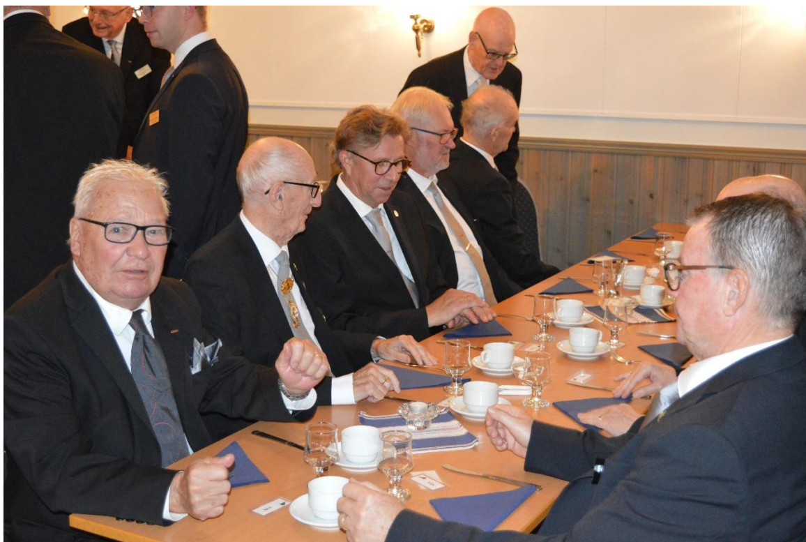
Med stor förväntan intas platserna vid bordet