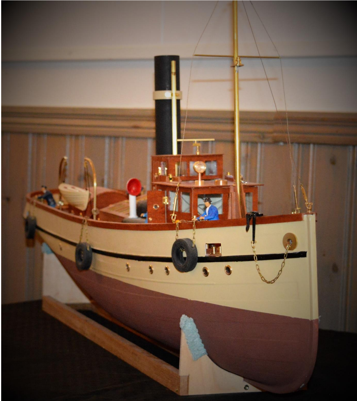
Bogserbåt, som seglar på holländska kanaler