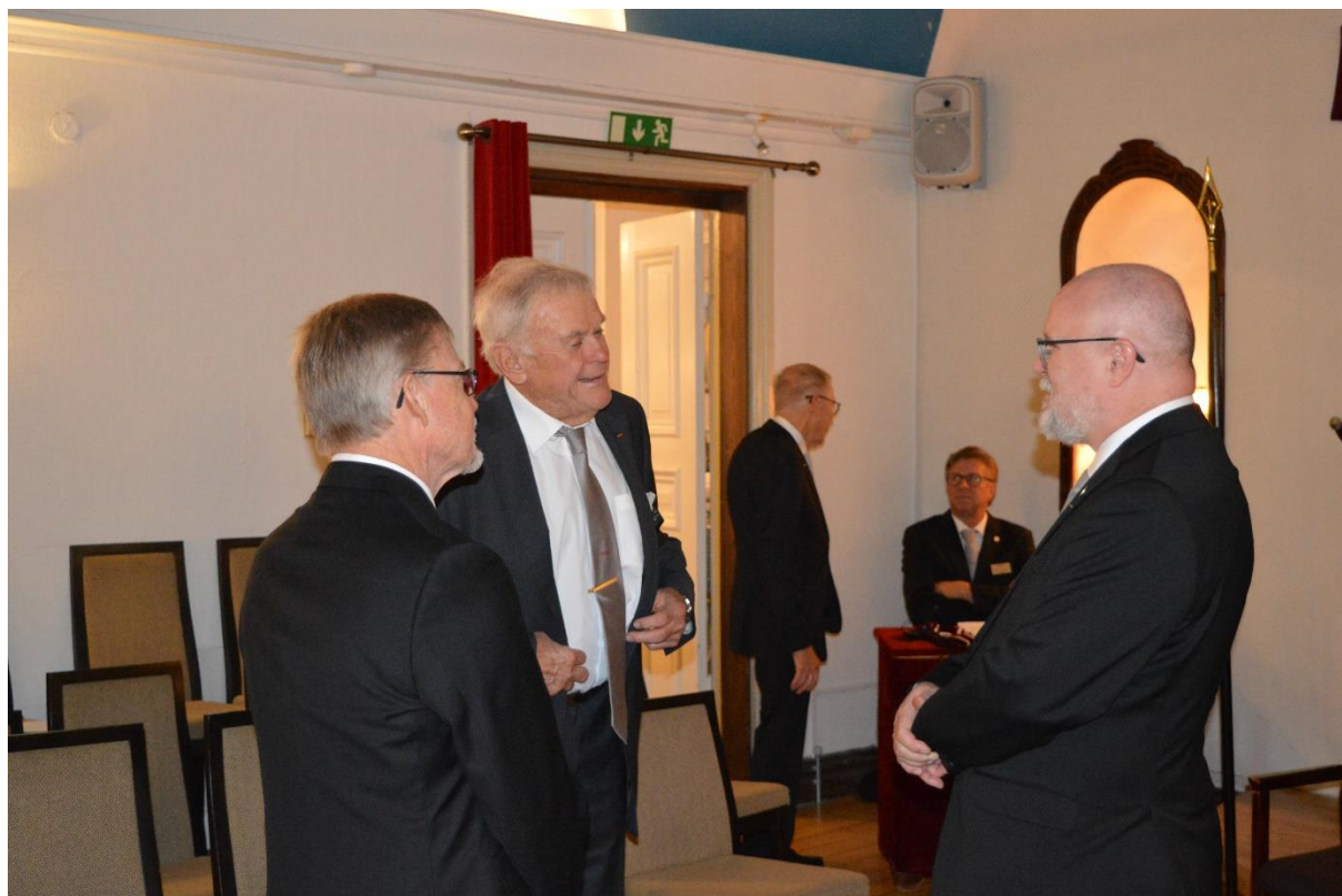
Logemötet förbereds i ordenssalen

I sedvanlig ordning skedde en förbrödring med många glada miner i logehusets undre regioner. Möjligen satt de glada minerna kvar hos många, från lördagens eminenta högtidlighet med anledning av logens 100 årsfirande.