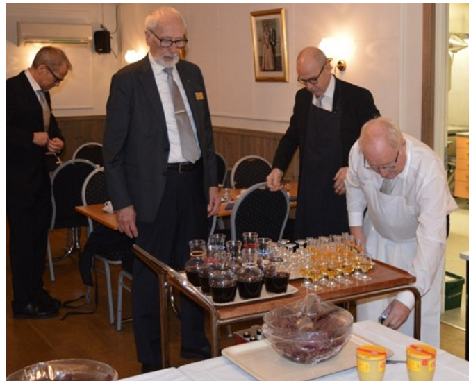
Kontroll av att alla beställningar kan effektueras.

Avslutningen hölls även enligt den traditionella ritualen och bröderna tågade ut till den väntande måltiden i Appollosalen.