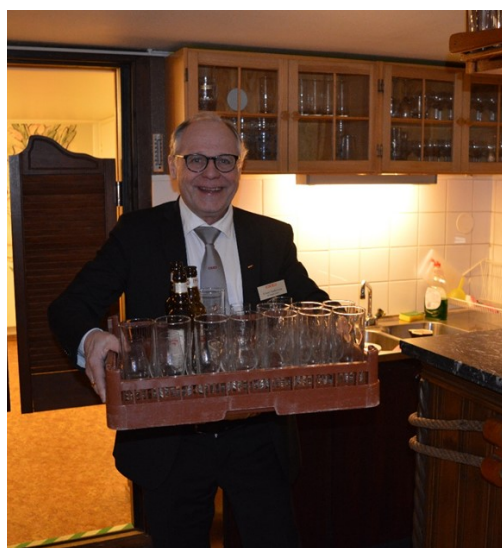
Var och en gör det man är bra på.