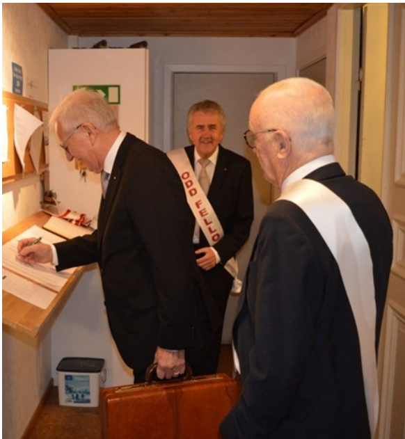
ÖM kryssar i närvarolistan

Det var första dagen då de flesta coronarestriktioner tagits bort. Avsikten var att detta möte skulle hållits som en digital fördjupningsloge, men förutsättningarna ändrades med kort varsel och det bjöds tillräckligt med tid för att förbereda och avisera om ett ordinarie fysiskt möte i logesalen. Knappt femti bröder hörsammade inbjudan och infann sig i logehuset.