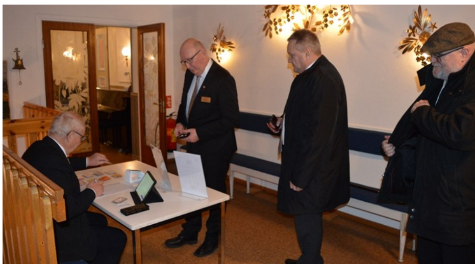
Incheckning till måltiden