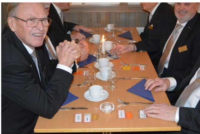
Korten på bordet.