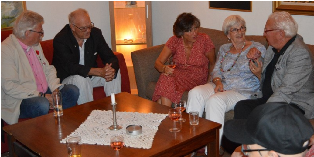
Glatt samspråk vänner emellan

I den sköna sommarkvällen har 69 bröder, flera med sina paranta damer, begivit sig till Kv Kaninen i Varberg för att avnjuta logens Västkustafton.