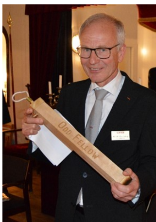
ÖM med budkaveln

Bland bröderna finns fortfarande åtta bröder, som inte är gottstående. Rapportflödet var begränsat inför sommarperioden. ÖM påminde om att efter sommarperioden har vi en kommande vänafton och ber alla bröder att inventera sina nätverk utifrån att identifiera nya lämpliga vågbrytarkandidater. De besökande bröderna från Borås överlämnade en budkavel.