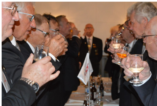
Skål utbringas för konung, loge och bröder i ny grad