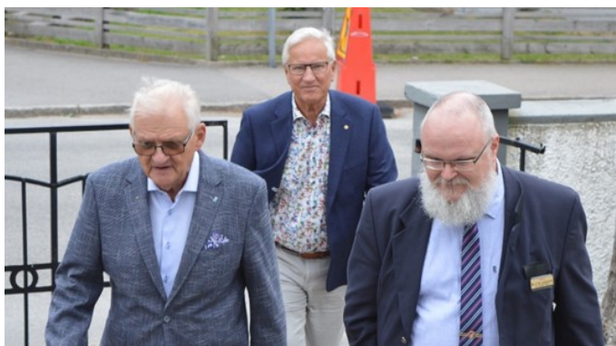
Bröder anländer till logemötet

Den 12 juni var det dags för första sommarsammanträdet 2019. Denna sommar har börjat som en mer normal sommar i Varberg jämfört med förra sommarens extremtorka.