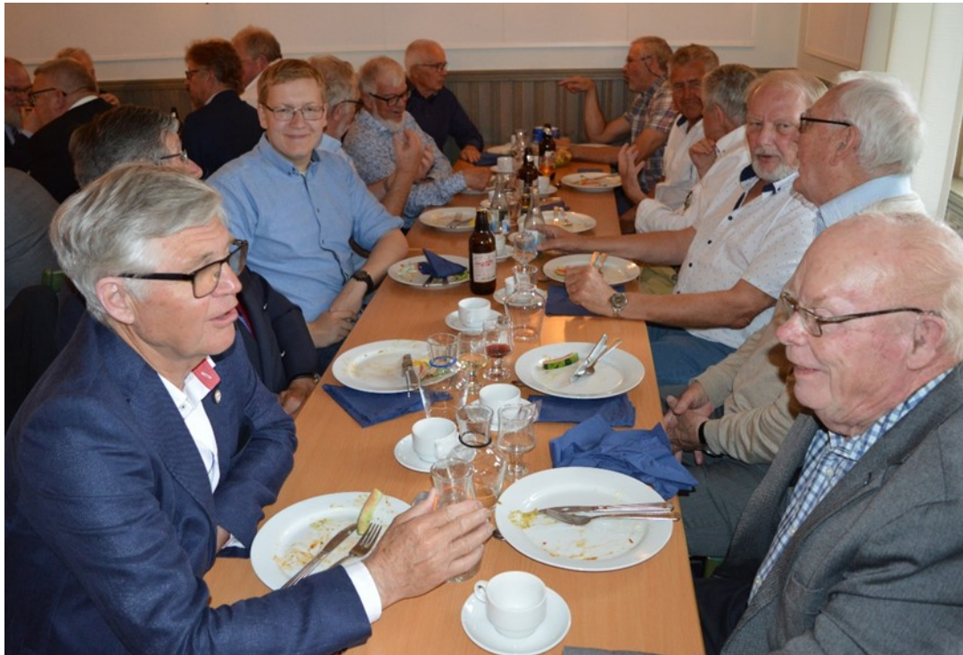
Glada miner och samtal kring .....