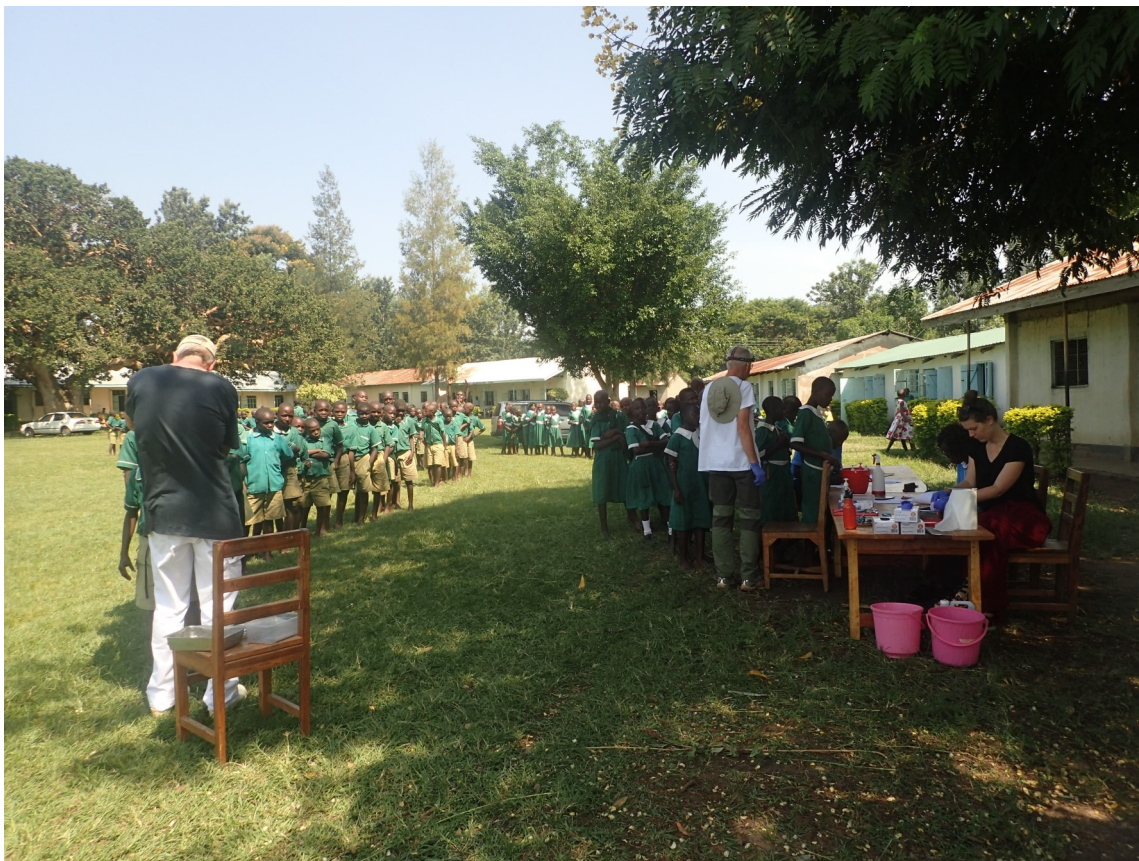
Tålmodiga patienter i väntan på sin tur

Därmed sagt att vi borde kanske lite till mans ta oss en funderare över det som vi upplever som problem verkligen är problem och istället skänka en tacksamhetens tanke över hur bra vi har det och hur privilegierade vi är.