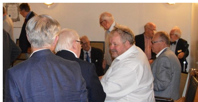
Sommarsammanträdet i logesalen