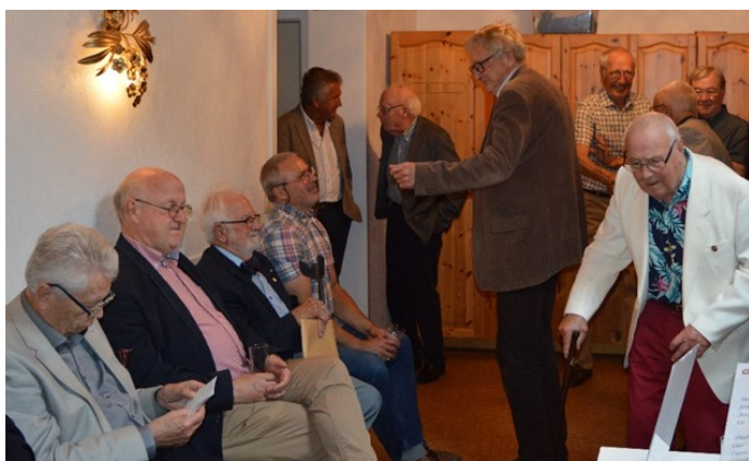
Bröder i avvaktan på att möta ÖM i logesalen

ÖM B-G Isberg öppnade logemötet enligt en förenklad dagordning inför öppna dörrar. Rapportflödet är sparsamt. ÖM påminde om den kommande vänaftonen den 9 oktober med hopp om att vi då kan mönstra några kandidater till nya lämpliga vågbrytarbröder. Vidare uppmanas de bröder, som ännu inte besvarat nomineringsutskottets enkät, att göra det.