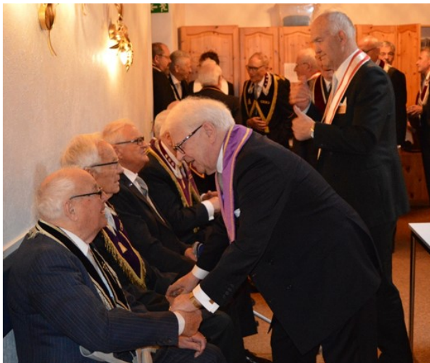
Bröderna samlas inför logemötet

Den 22 maj samlas B83 Vågbrytaren till vårens sista ordinarie logemöte. På agendan finns bland annat gradgivning i andra logegraden.