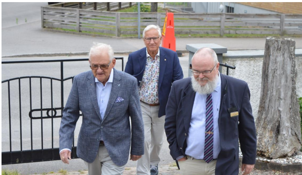
Bröder anländer till logemötet

Den 22 juni var det dags för första sommarsammanträdet 2019. Denna sommar har börjat som en mer normal sommar i Varberg jämfört med förra sommarens extremtorka.