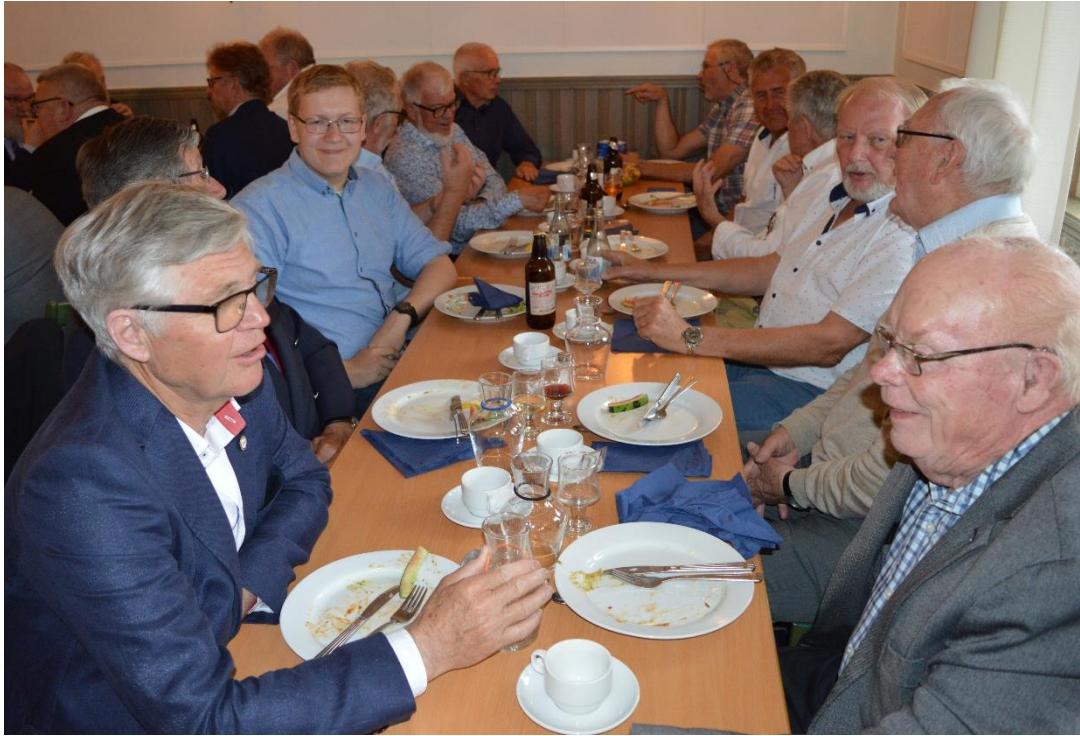
Glada miner och samtal kring .....