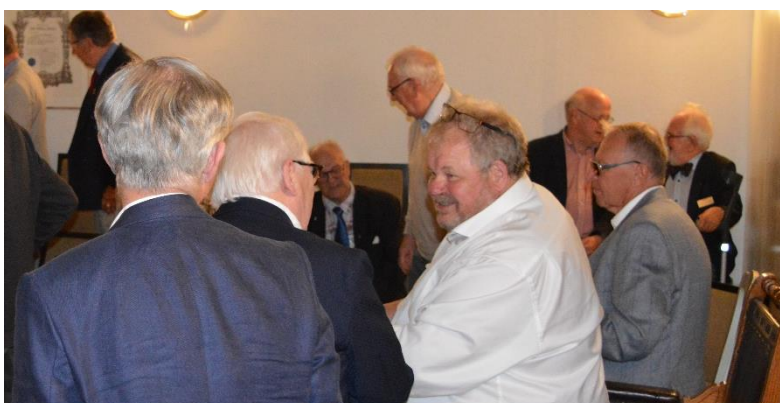
Sommarstämma i logesalen