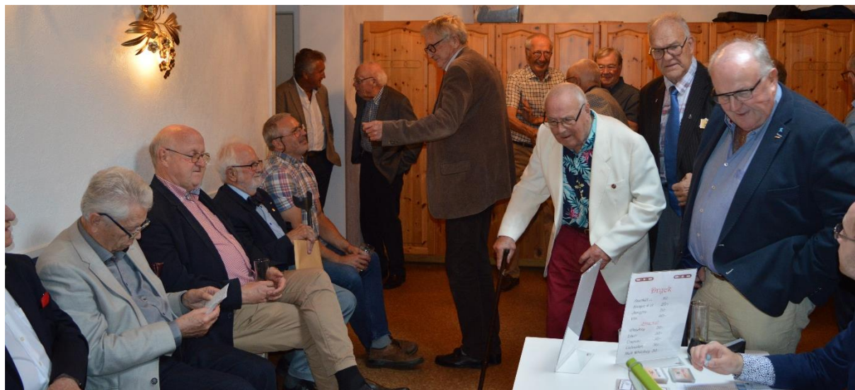
Bröder i avvaktan på att möta ÖM i logesalen

ÖM B-G Isberg öppnade logemötet enligt en förenklad dagordning inför öppna dörrar. Rapportflödet är sparsamt. ÖM påminde om den kommande vänaftonen den 9 oktober med hopp om att vi då kan mönstra några kandidater till nya lämpliga vågbrytarbröder. Vidare uppmanas de bröder, som ännu inte besvarat nomineringsutskottets enkät, att göra det.