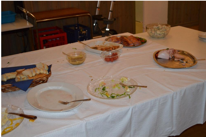
Tabberage på det nyligen dignade buffébordet