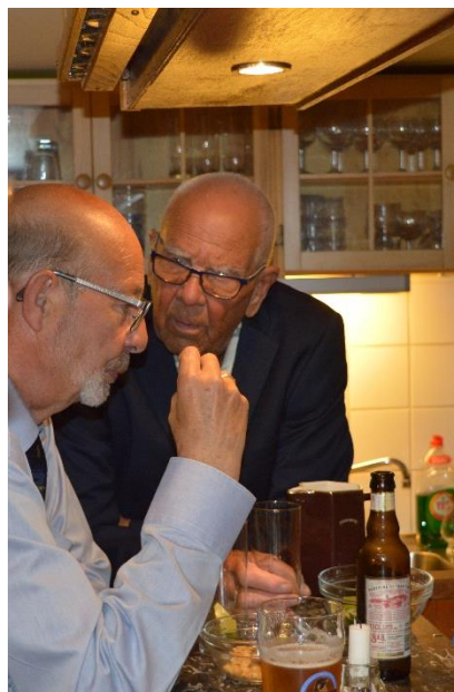
Ett par reflektioner innan kosan styrs hemåt.