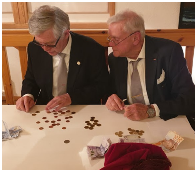
Räkning av insamlade medel

Om vi undviker att skada andra samtidigt som vi strävar efter att göra gott för människorna omkring oss, har vi egentligen lev upp till de grundläggande krav det innebär att vara en medmänniska. Då lever vi efter den Gylene Regeln!