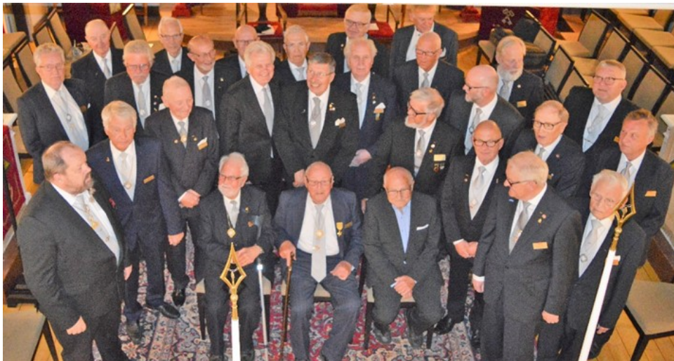
De närvarande veteranerna

Kaplans tankar rörde sig kring vad som är livets tyngsta börda.