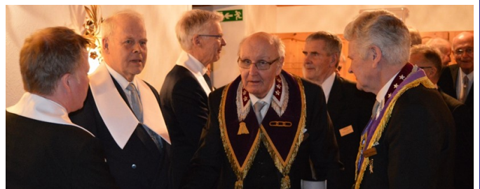
De nya bröderna gratuleras till sitt inträde i invigningsgraden