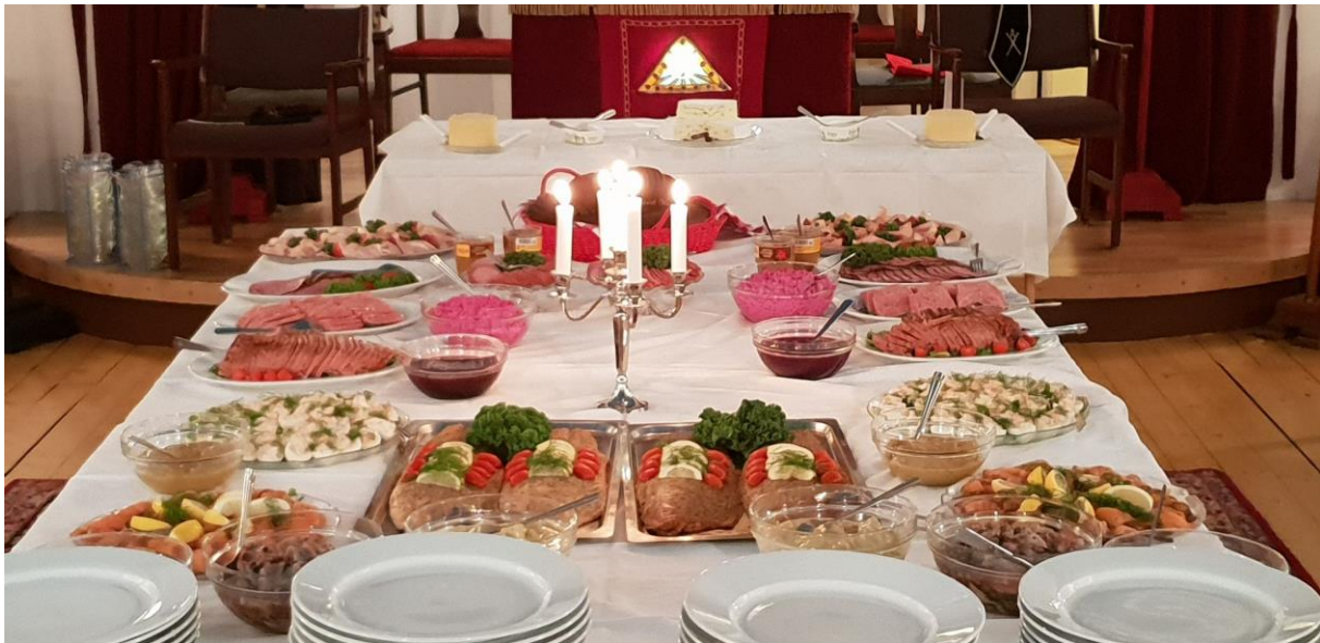
Det dignande julbordet

Efter att ett dignande, välsorterat och välsmakande julbord tillsammans med quantum satis dryckjom funnit sin plats