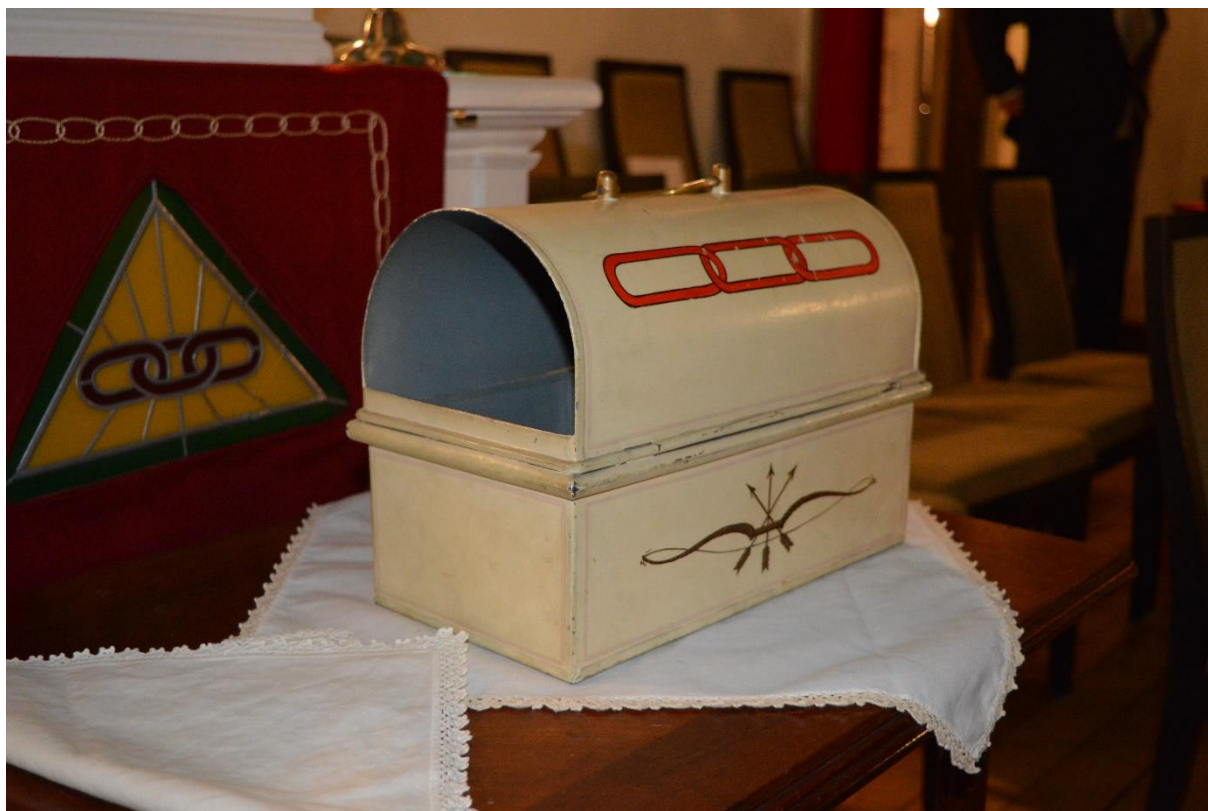
Det gamla balloteringskrinet

Sedan gjordes ballotering för åtta stycken blivande bröder. Balloteringen tog sin modiga tid utifrån ett ovanligt stort antal receptiender. Balloteringen utföll gynnsamt för samtliga.