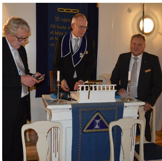
Kom vi ihåg allt nu?

Efter logemötet samlades bröderna i Apollosalen och avnjöt en som vanligt förstklassig anrättning. Den bestod av helstekt fläskkarré med tillbehör.