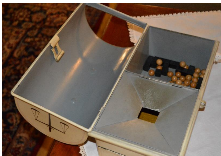
Ytterligare interiör med kulor och tärningar

ÖM uppdrog att kalla receptienderna och deras faddrar till invigningsgraden kommande möte den 28 november.