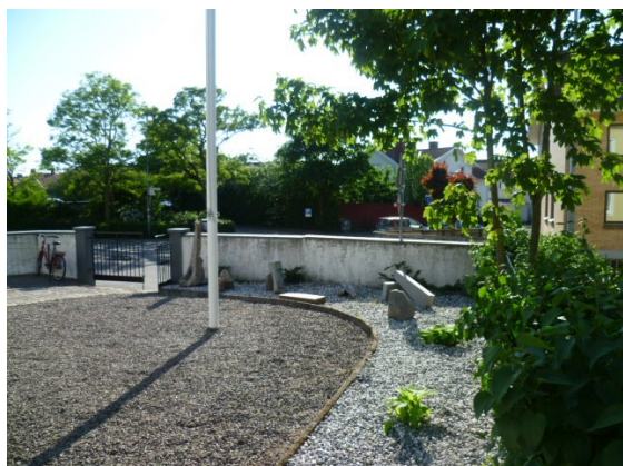
Logens trädgård i sommarskrud

Trots en strålande sol och 25 värmegrader samlades en trogen skara bröder på onsdagskvällen till ett logemöte med gradgivning till Kärlekens grad.