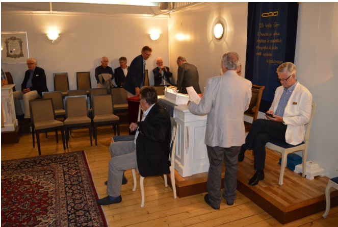
Mötet börjar i rappet

Stämningen steg efter hand och inte minst desserten, som bestod av jordgubbar och glass bidrog till detta.