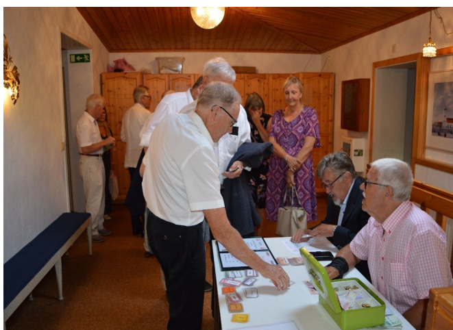
Det fungerar väl med Swish i kassakön

Sommarmötet var som vanligt summariskt. Det tog 12 minuter i anspråk.