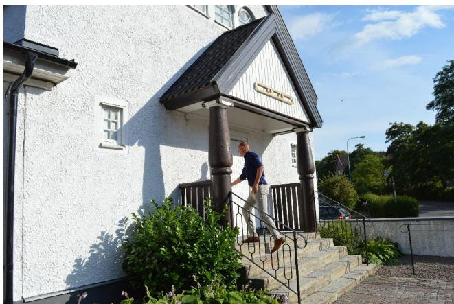
Logehuset väntar på bröderna och deras damer.