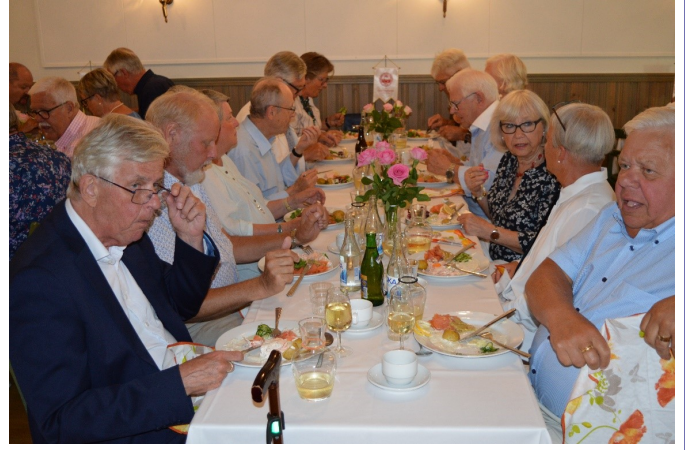
Gemytlig stämning kring bordet