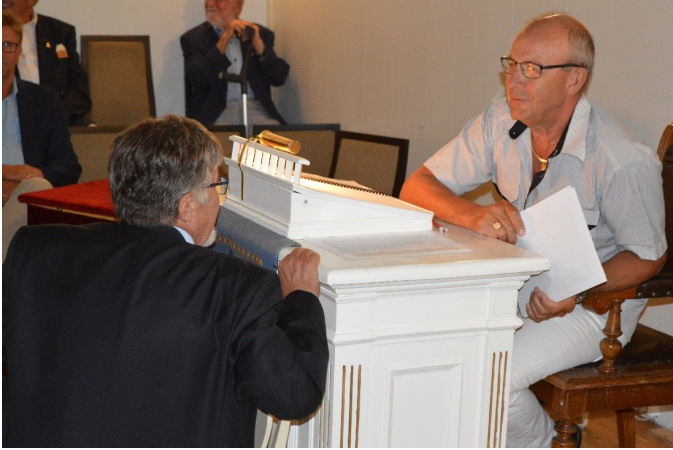
Logemötet i sommarklädsel