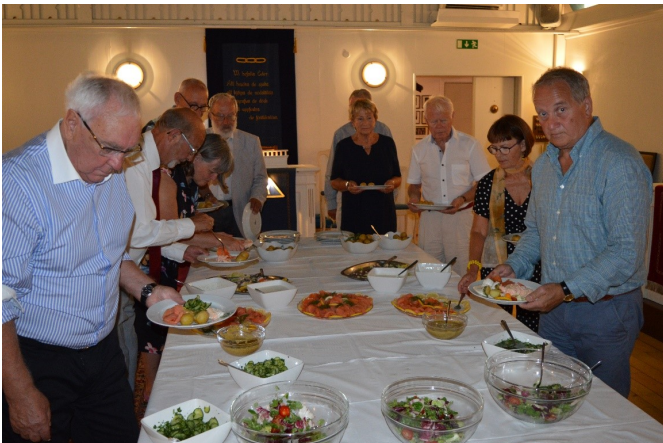
Gästerna låter sig frestas av den utsökta laxbuffén

Stämningen steg efter hand och inte minst desserten, som bestod av jordgubbar och glass bidrog till detta.