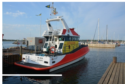
Räddningskryssaren ODD FELLOW

Sjöräddningssällskapets drygt 2 300 frivilliga sjöräddare har jour dygnet runt, året om. När larmet går lämnar vi kaj inom 15 minuter. Målsättningen är att nå en nödställd inom 1 timma. Upptagningsområdet är från Lerkil i norr till "Läjet" i söder, men stationerna hjälps åt, även över till Danmark om så behövs.