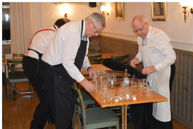
Allt skall tas om hand

Unite People har en Facebooksida på: https://www.facebook.com/unitepeoplevarberg/ Kvällen insamling gick till Unite People.