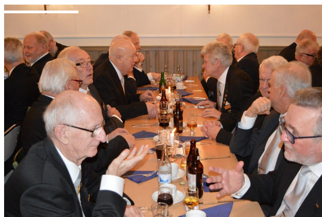
Intressanta samtal i väntan på sin tur till matkontrollen.

Det bjöds utöver förplägnaden på ett mycket uppskattat föredrag av Adnan Bainca från Unite People. Adnan är grundare och drivkraft i Unite People.