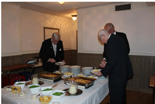
Övermästaren tar taten i matkön

Dagen middag bestod av en mycket god fiskpud- ding med dillsås och gröna ärtor. Till kaffet fanns en kaka med chokladsträngar ovanpå.