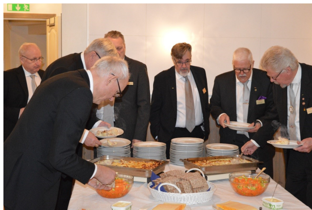
Hungriga bröder vid matkontrollen.

Som vanligt kunde bröderna samlas kring en delikat måltid. Den bestod av blomkålsgratäng med kassler.