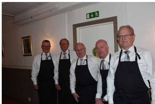
Serveringspersonalen redo att gripa in

Efter logemötet samlades bröderna till en som vanligt välsmakande måltid, som denna gång bestod av: Kalkonfilé, potatis, rödkål och gräddsås. Kaffe och kaka.