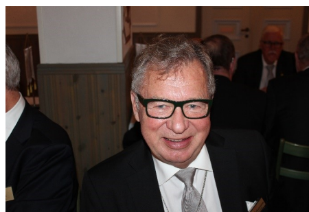
Glada bröder i muntert sampråk