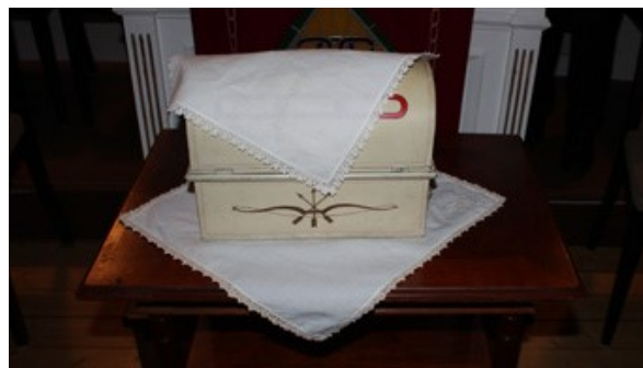
En kula för mycket och det blir mindre kul

Udermästaren och Bevakande broder kontrollerar hur många bröder som balloterar och sedan kontrollerar de också att antalet kulor och tärningar stämmer med antalet som har balloterat. ÖM gör så en sista kontroll innan ett beslut kan meddelas.