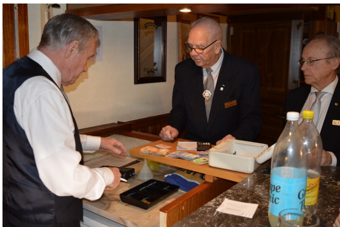
Räkenskapsens timme inträffade även denna kväll.